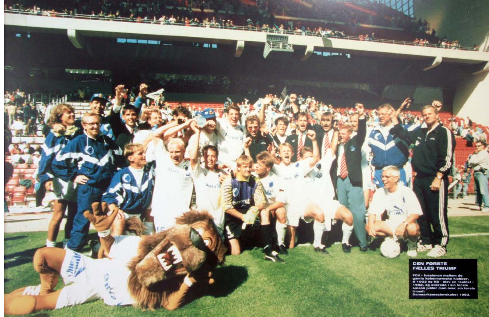
DEN FØRSTE FÆLLES TRIUMF FCK - fusionen mellem de gamle københavnske klubber, B 1903 og KB - blev en realitet i 1992, og allerede i sin første sæson jubler man over sin første triumf: Danmarksmesterskabet 1993.