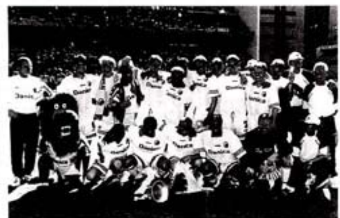
Gode hold! eller en velfortjent finalesejr.