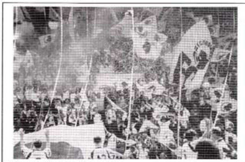
Kanon gang i den på FanClub-afsnittet.