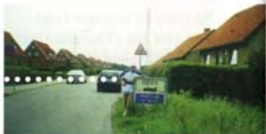
Ung FCK'er fotograferet udenfor en jysk by med et velklingende navn. Vi tager handskene op og giver en flaske sprit til den, der besøger Hryläninen og tager et billede ved bygrænsen.