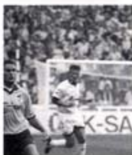
Peter ude af fokus! Sorry

Er Lyngby ikke en pudsig klub? Det er lidt ligesom Wimbledon, de har næsten ingen tilskuere og ligger i en bydel, hvor der ingen interesse er