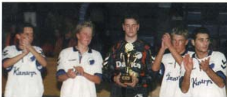
Vinderne fra Borup. RESPEKT!

FCK3 gik også videre fra deres pulje, 2 kampe, 2 sejre og en målsscore på 10-1.