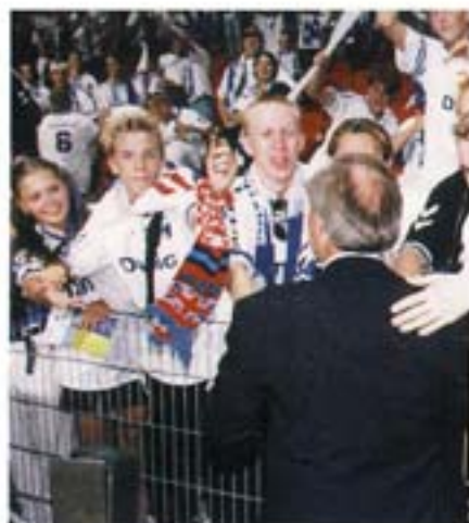
En ellevild fan prøvede at komme ind på banen, men årvågne tilskuere holdt ham tilbage.

Derefter spurgte vi om hvilke goder de mange nye aktionærer kan forvente at få. Det bliver desværre ikke sådant som det eksempelvis er i Tivoli, hvor alle aktionærer får et gratis sæsonkort. Det ville simpelthen give for store administrative omkostninger, da aktierne hele tiden skifter ejere. Men man vil sagtens kunne forestille sig, at der til enkelte kampe vil blive sendt billetter ud til samtlige aktionærer. Et andet gode ved at være aktionær kunne blive en fordelagtig forkøbsret ved en senere aktieudvidelse.