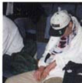
Ikast-AaB når sit klimaks

Det blev ikke nogen særlig spændingsmættet finale, dertil var FCK3 for teknisk gode og scorede allerede til 1-0 efter 20 sek. Efter fire minutters spil stod det 2-0, da havde AB haft en mand udvist i over to minutter. Det tredje og sidste