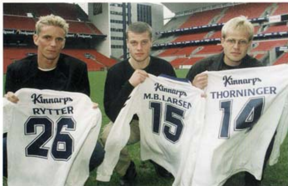
- Kan I rodder så komme væk fra den bane!

agent (mellemanderen Vincenzo Morabito - red.), som jeg senere fandt ud af, gik og lavede aftaler for 2 andre udenlandske spillere i klubben samtidig med, at han forsøgte at forhandle for mig. Han prøvede faktisk at komme af med mig, for at