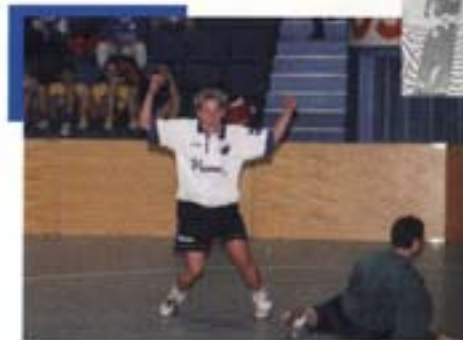
- Ku' Døllefjelde-Musse ikke komme? Fedt!

mål faldt efter 5 min. og 30 sek. spil, og så var den finale afgjort. 3-0 til FCK, og hermed satte Fan Clubben en tyk streg under, at FCK regerer indendørs...vi bøjer os dog i støvet for Døllefjelde-Musse.