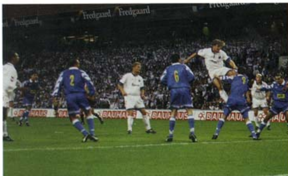
- og den er fra tjeneren på Rio Bravo!

spillet 2 kampe, blev skadet og var væk i 2 uger. Clemme, som afløste mig, gjorde det jo desuden meget godt, så der var også lidt pres på mig. Så kommer jeg ind og laver den der og ugen efter den ude mod AB. Så kører det bare. Det var meget dejligt, det var det.